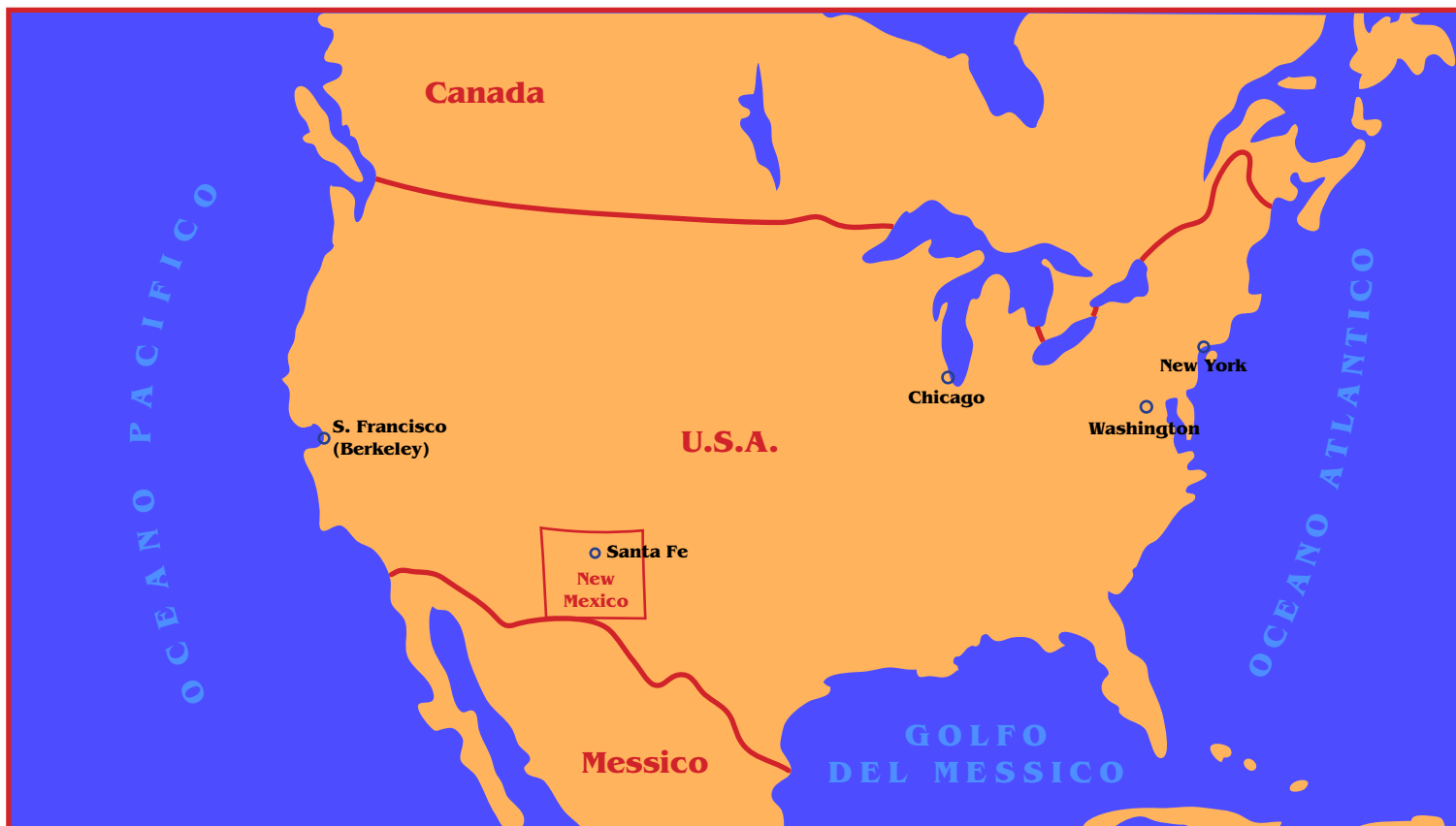
Stati Uniti d'America (città d'interesse e New Mexico)